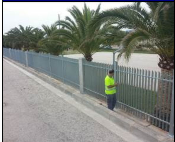
Final de las Obras