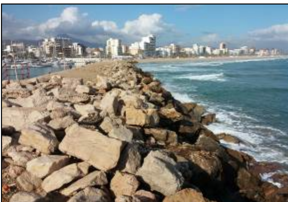
Estado inicial antes de la recolocación en talud