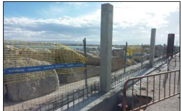
Ejecución de pilares y muro de cerramiento