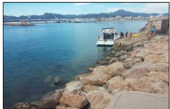
Tendido de la fibra submarina