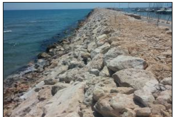
Estado final de la recolocación en talud de escollera