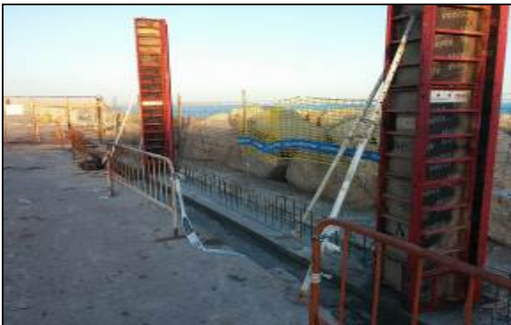
Ejecución de cimentación del muro