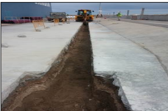
Ejecución de la zanja para la canalización